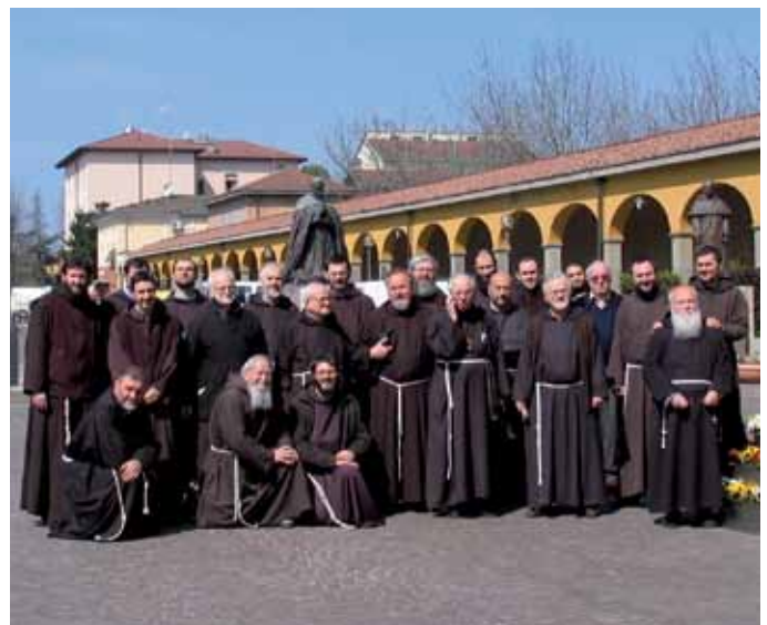
Gruppo di frati cappuccini provenienti dai conventi dell'Emilia Romagna in pellegrinaggio al Santuario. Marzo 2011