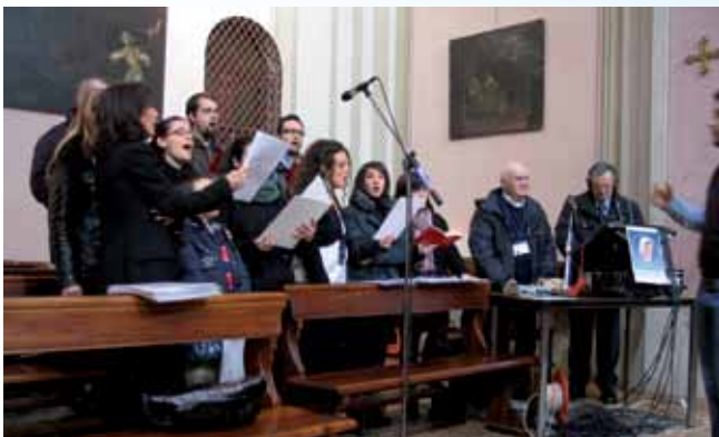
Coro Santa Maria della Steccata di Parma, che ha animato la Santa Messa trasmessa da Radio Maria. Febbraio 2011

In quella cena, a Betania, viene celebrata la vera amicizia, disinteressata, capace di giocare in perdita per l'amico; un'amicizia che non tiene conto del proprio tornaconto, che dimentica le logiche mercantili dei bilanci in pareggio, che rifiuta di chiudere i rapporti pur di terminare in attivo, dissanguando l'amore per gonfiare il guadagno. Quella sera si apparecchiò per una delle poche cene in cui sedettero commensali due caratteristiche essenziali dell'amicizia: la gratuità e la gratitudine.