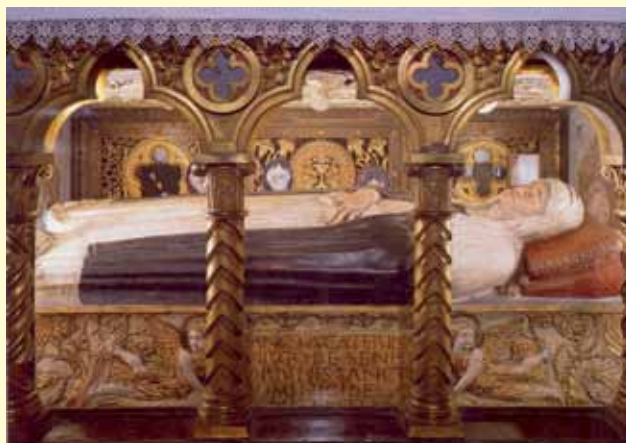
Isaia da Pisa, Sepolchro di S. Caterina da Siena (1430), Basilica di Santa Maria sopra Minerva, Roma

Cari fratelli e sorelle, impariamo da santa Caterina ad amare con coraggio, in modo intenso e sincero, Cristo e la Chiesa. Facciamo nostre perciò le parole di santa Caterina che leggiamo nel Dialogo della Divina Provvidenza , a conclusione del capitolo che parla di Cristo-ponte: “Per misericordia ci hai lavati nel Sangue, per misericordia volesti conversare con le creature. O Pazzo d’amore! Non ti bastò incarnarti, ma volesti anche morire! (...) O misericordia! Il cuore mi si affoga nel pensare a te: ché dovunque io mi volga a pensare, non trovo che misericordia” (cap. 30, pp. 79-80).