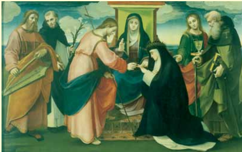
Sposalizio mistico di Santa Caterina da Siena con Gesù alla presenza di Maria (Bagnacavallo Bartolomeo Ramenghi, 1484-1542, Bologna, Pinacoteca Nazionale)