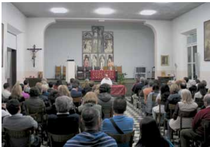
Incontri di Catechesi di Quaresima su: "Cosa c'è dopo? Alla Fine? Oltre questa vita?" molto partecipati. Marzo 2011, salone conferenze del Santuario.