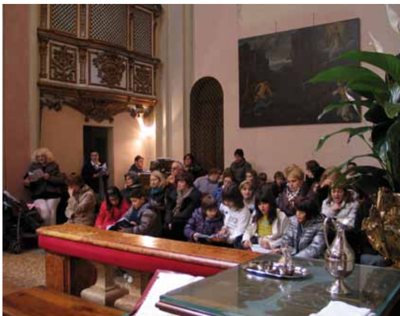
Giovanissimi e catechisti della parrocchia di Ozzano Taro

Certo costa anche sacrificio vivere in modo vero l'amore - senza rinunce non si arriva a questa strada - ma sono sicuro che voi non avete paura della fatica di un amore impegnativo e autentico. E' l'unico