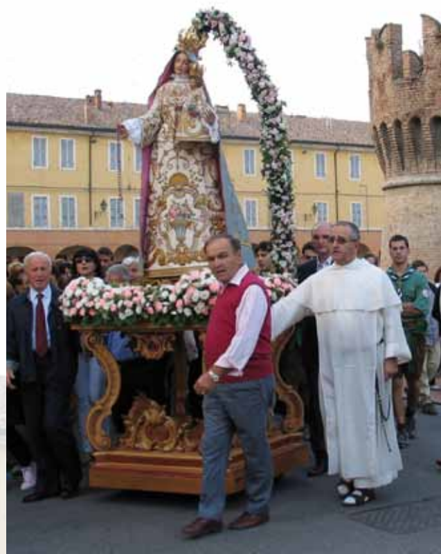
L'immagine di Maria passa per le nostre strade ricordando a tutti che siamo amati da Cristo Gesù

Con tali sentimenti affido i frutti di questo Congresso all'intercessione di Maria