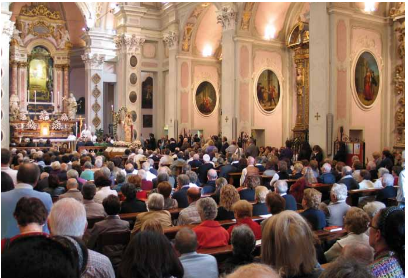
Festa della Madonna del Rosario, 2010

Chi fa passare il divorzio per un progresso, un diritto e un segno di civiltà dovrà render conto a Dio di tutte le nostre lacrime e di tutti questi ragazzi difficili. E tutto perché lui ha trovato l'amore e ha diritto alla felicità! E pensare che io ho sempre creduto che l'amore fosse prendersi a cuore la felicità degli altri!