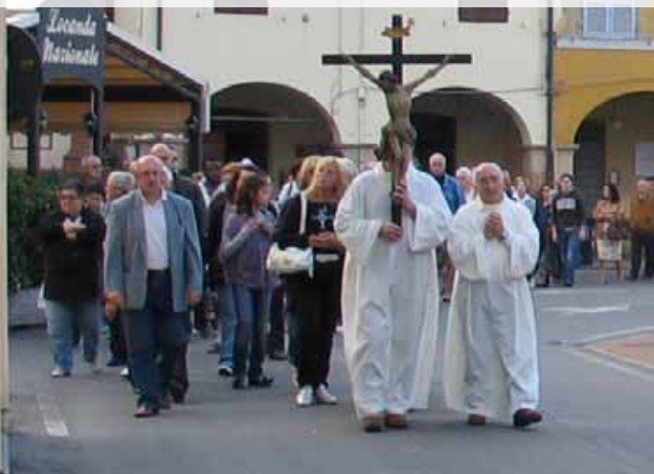
Processione per le vie di Fontanellato. Festa Madonna del Rosario 2010

A tal fine occorre far sì che i visitatori non dimentichino che i santuari sono luoghi sacri e che quindi vi si comportino con devozione, rispetto e decoro. In tal modo la Parola di Cristo, il Figlio del Dio vivo, potrà risuonare con chiarezza e l'evento della sua morte e risurrezione, fondamento della nostra fede, verrà proclamato nella sua interezza. Inoltre va curata con grande scrupolosità l'accoglienza del pellegrino, dando il giusto risalto, tra l'altro, alla dignità e bellezza del santuario, immagine della "tenda di Dio con gli uomini" (Ap 21,3); ai momenti e agli spazi di preghiera, tanto personali che comunitari; all'attenzione alle pratiche di pietà. Parimenti non si insisterà mai abbastanza sul fatto che i santuari devono essere fari di carità, incessantemente dedicati ai più sfa-