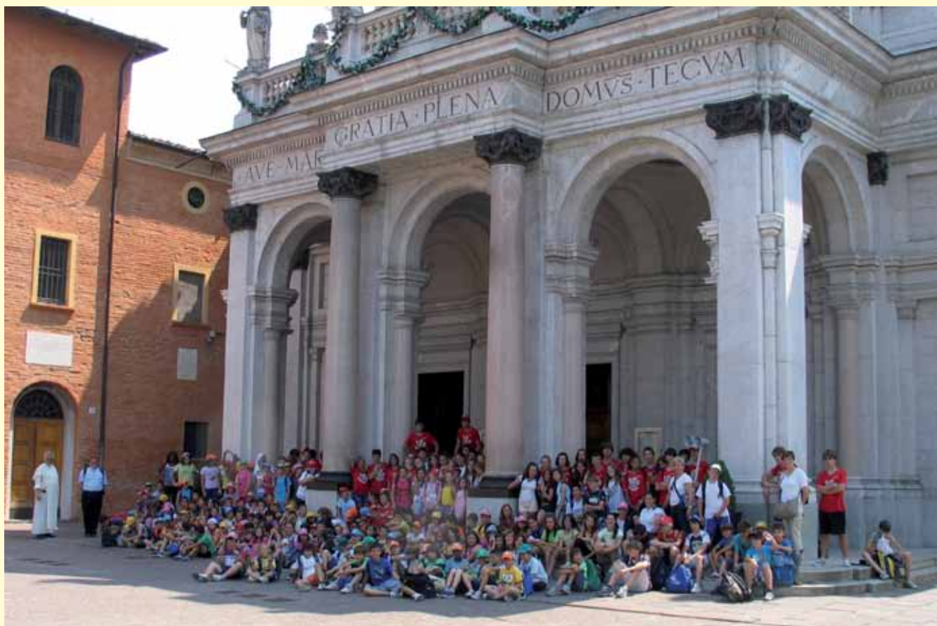
Pellegrinaggio giovanissimi e giovani della Diocesi di Brescia. Giugno 2011.

In realtà, io stesso, per la mia esperienza e per i contatti che ho con i giovani, so bene che ogni generazione, anzi, ogni singola persona è chiamata a fare nuovamente il percorso di scoperta del senso della vita. Ed è proprio per questo che ho voluto riproporre un messaggio che, secondo lo stile biblico, evoca le immagini dell'albero e della casa. Il giovane, infatti, è come un albero in crescita: per svilupparsi bene ha bisogno di radici profonde, che, in caso di tempeste di vento, lo tengano ben piantato al suolo. Così anche l'immagine dell'edificio in costruzione richiama l'esigenza di valide fondamenta, per-