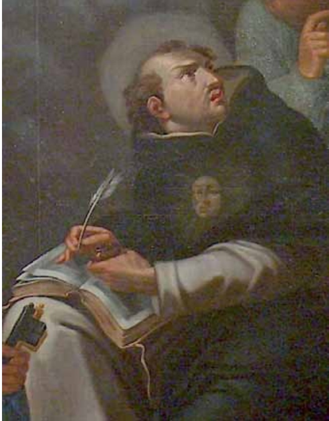
Volto di San Tommaso nel quadro nell'altare a lui dedicato in Santuario

darci ancora oggi e a tutti nella comunità ecclesiale.