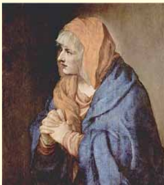
Tiziano Vecellio, Mater Dolorosa , Pieve di Cadore, Veneto

Quando la morte dissolve il mio corpo aprimi, Signore, le porte del cielo, accogliami nel tuo regno di gloria.