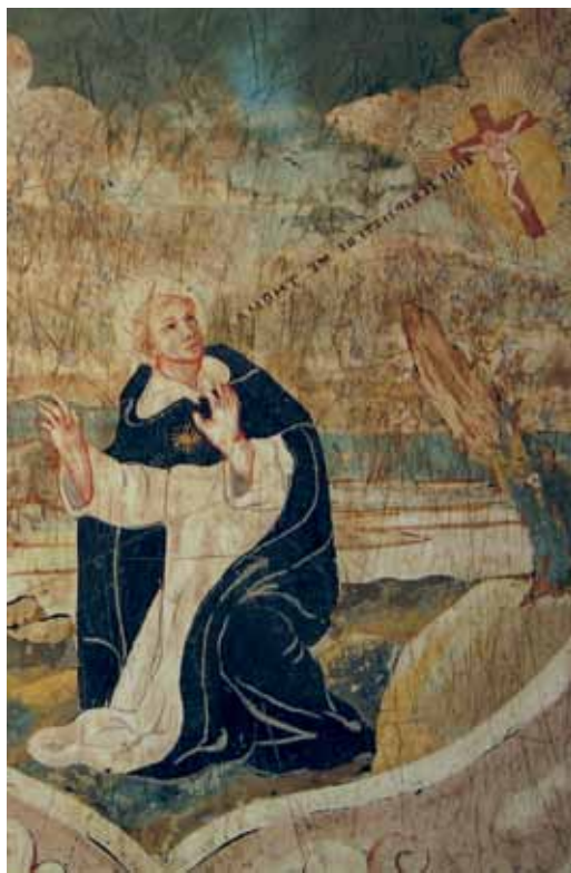
Scagliola artistica, paliotto dell'altare di San Tommaso in Santuario. Crocifisso che parla a San Tommaso, miracolo avvenuto nella Chiesa di San Domenico Maggiore a Napoli.

Volutamente ho parlato di "lezione" che ha da