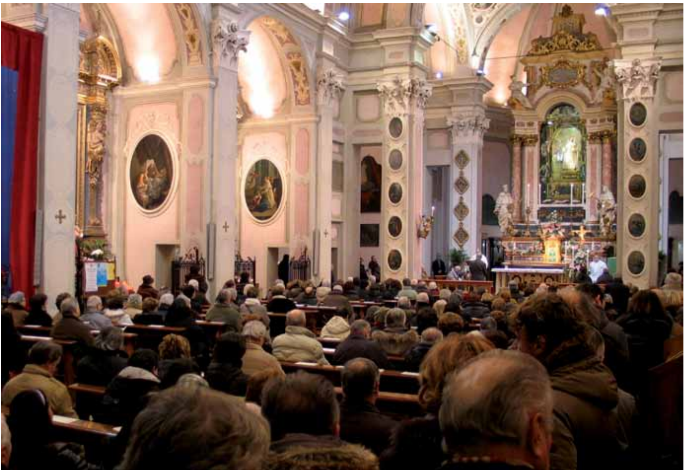
Celebrazione in Santuario per la festa del Battesimo di Gesù.

Tutto ciò è molto pericoloso perché quando il nostro cuore è turbato e agitato perde la forza di conservare le virtù che aveva conseguito e insieme perde la forza di resistere alle tenta-